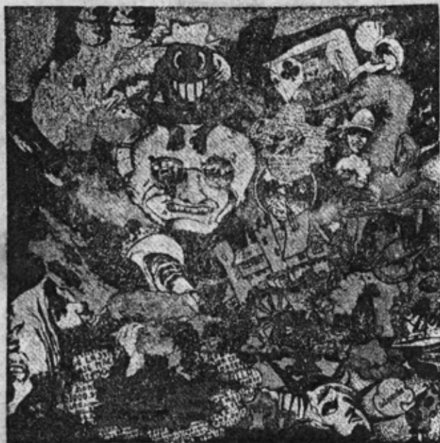
"ETCETERA" Laghonia (Mag 2412) Estéreo

Los que conocieron la trayectoria inicial de este grupo 'antes New Juggler Sound, saben que siempre hizo música de calidad, por lo que este L.P. fue —quizás ocultamente— esperado por todos, pero aún así, el disco