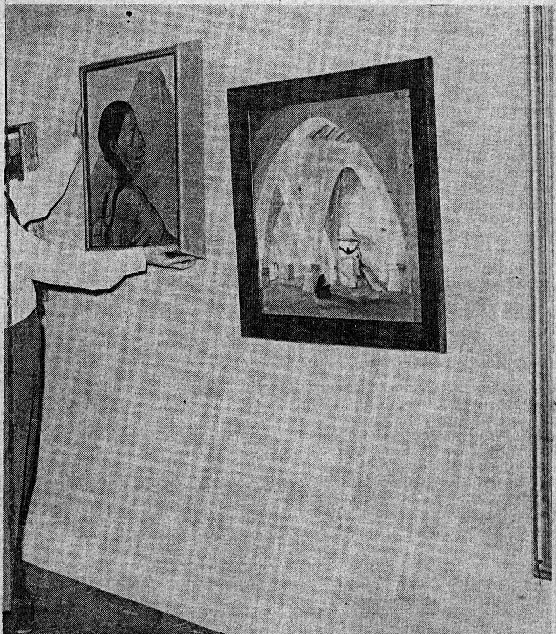
La Cultura debe salir al pueblo no permanecer enclaustrada.

(1) Discurso del Ministro de Educación en la entrega de los Premios Nacionales de Cultura, 1975.